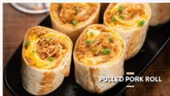
PULLED PORK ROLL