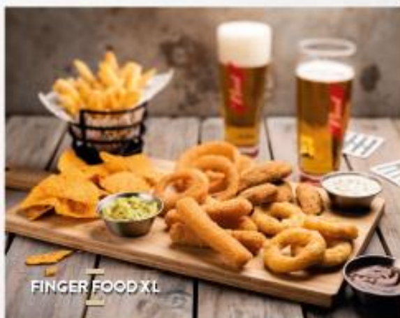
FINGER FOOD XL