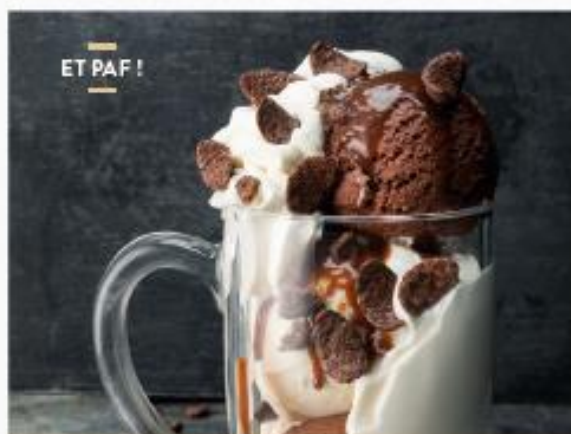
ET PAF !