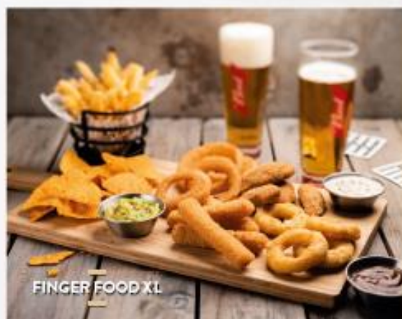
FINGER FOOD XL