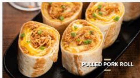
PULLED PORK ROLL