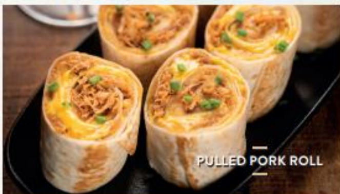
PULLED PORK ROLL