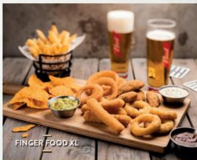
FINGER FOOD XL