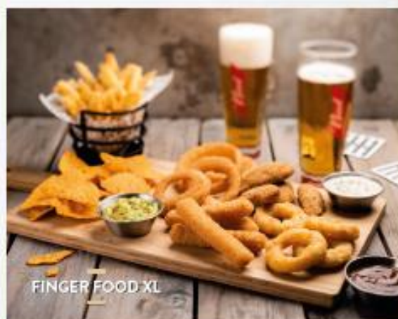
FINGER FOOD XL