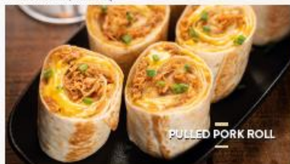
PULLED PORK ROLL