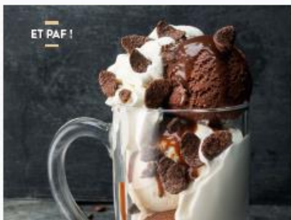
ET PAF !