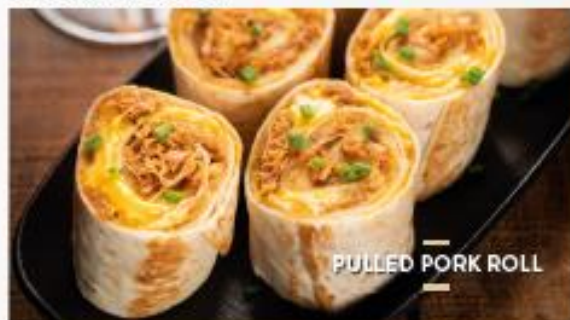
PULLED PORK ROLL