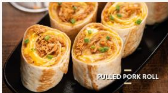
PULLED PORK ROLL