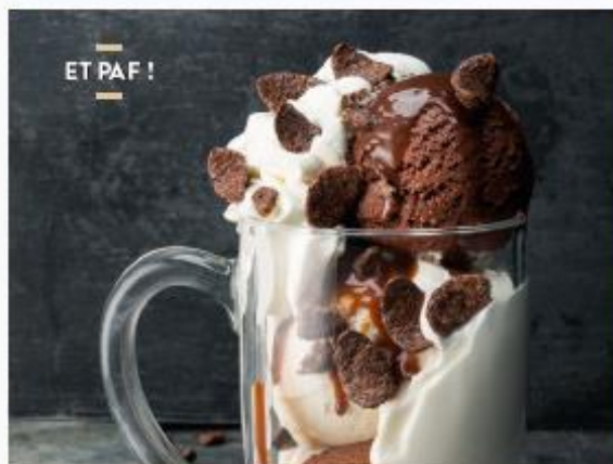
ET PAF !