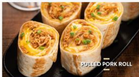
PULLED PORK ROLL