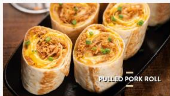
PULLED PORK ROLL