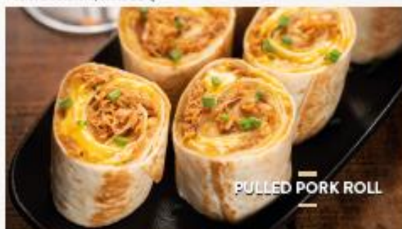
PULLED PORK ROLL