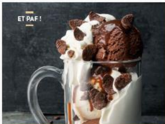
ET PAF !