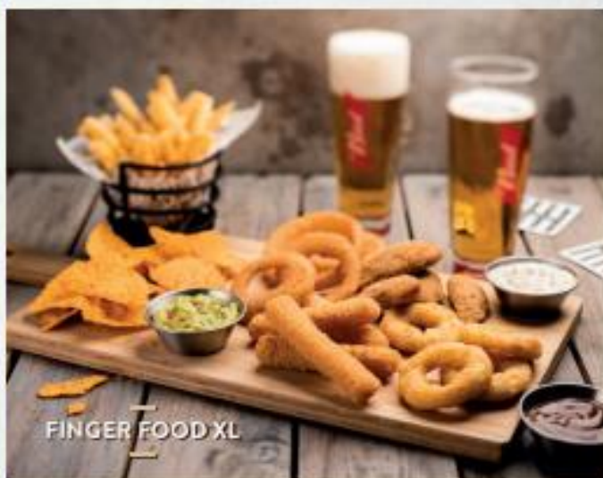
FINGER FOOD XL