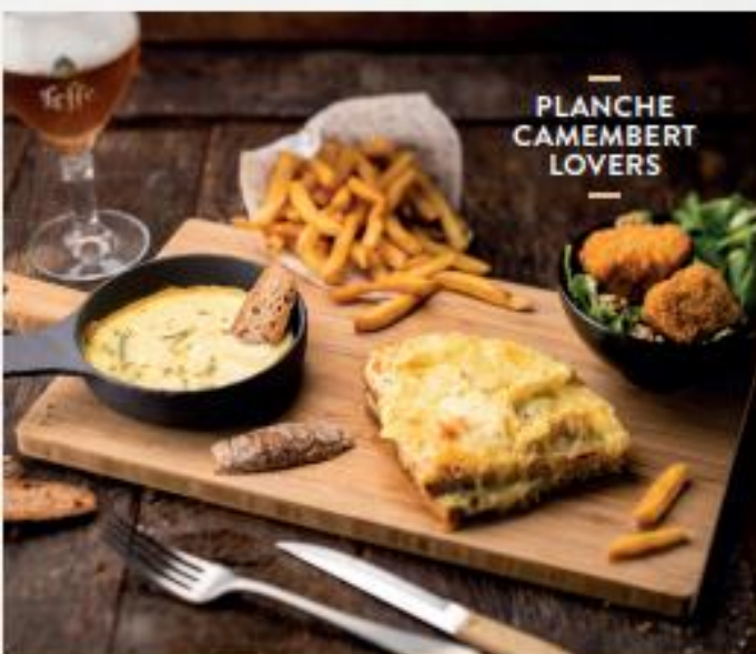
PLANCHE CAMEMBERT LOVERS