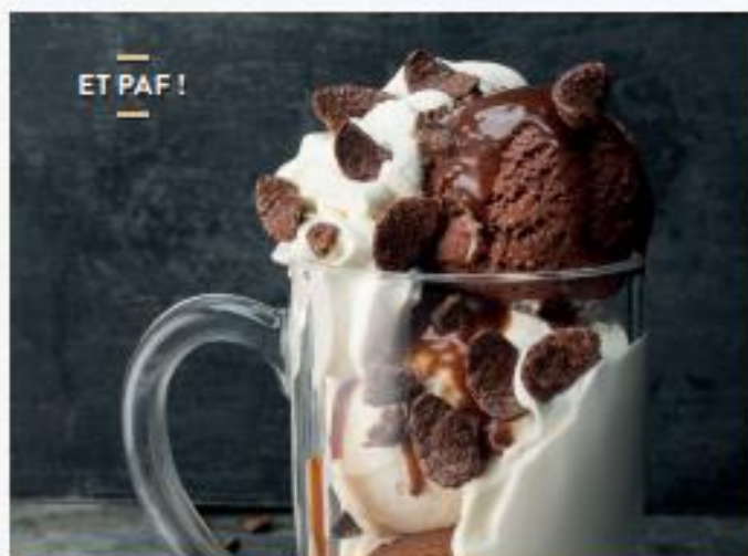
— ET PAF ! —