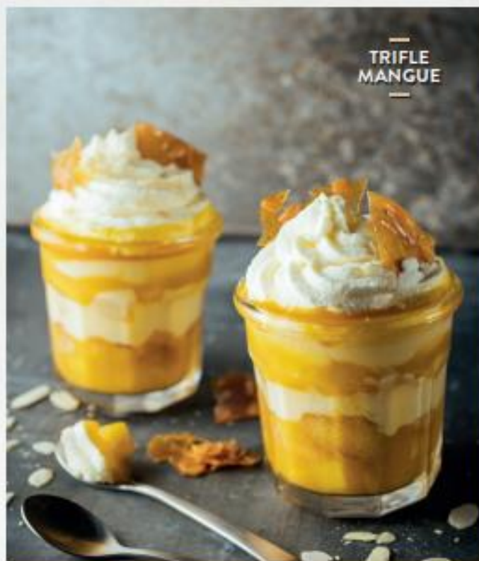
— TRIFLE MANGUE —