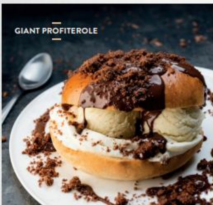
— GIANT PROFITEROLE —