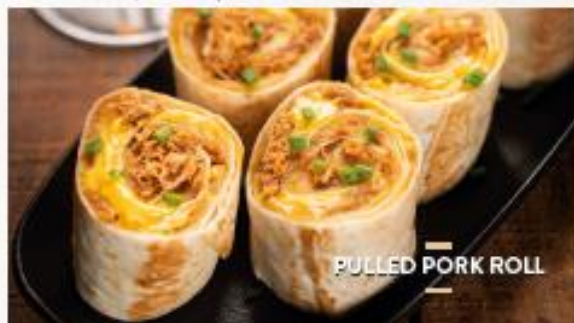
PULLED PORK ROLL