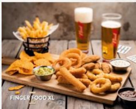
FINGER FOOD XL