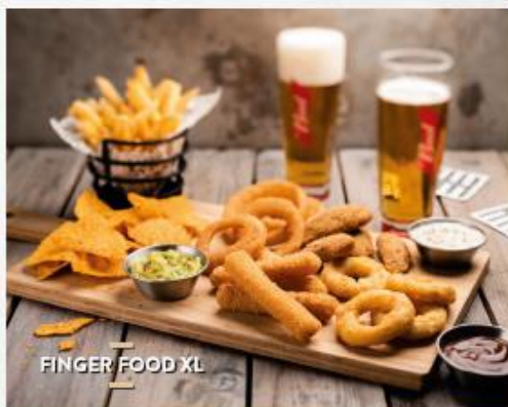
FINGER FOOD XL