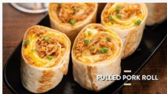
PULLED PORK ROLL