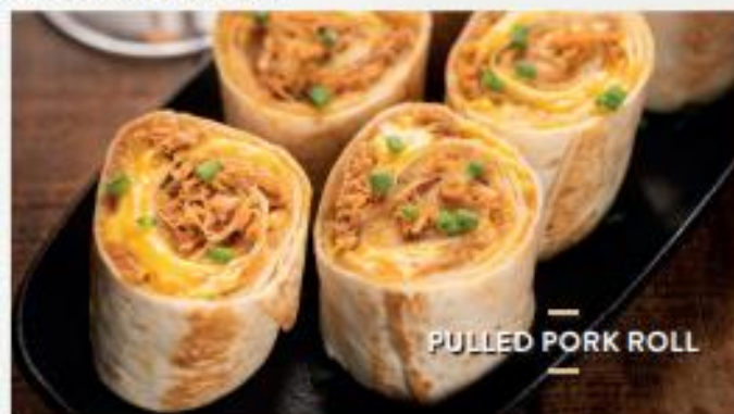
PULLED PORK ROLL