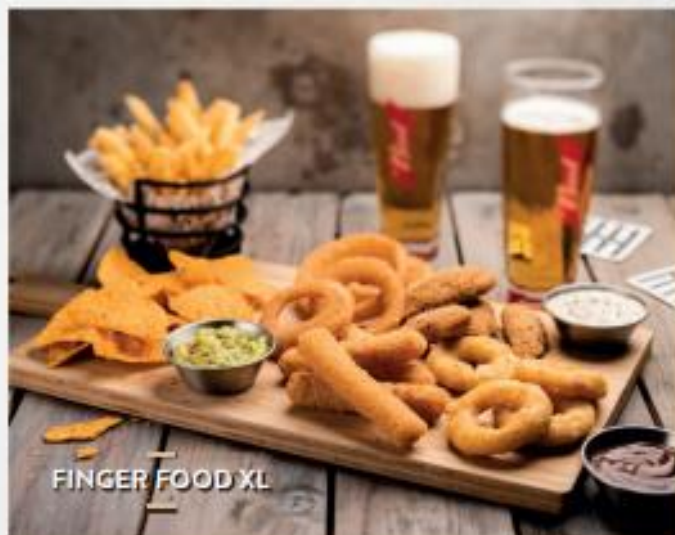
FINGER FOOD XL