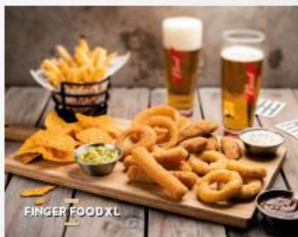
FINGER FOOD XL