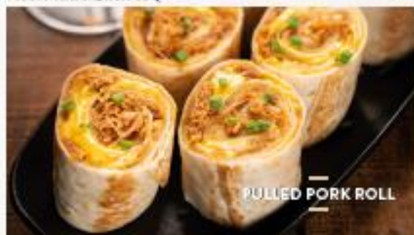
PULLED PORK ROLL